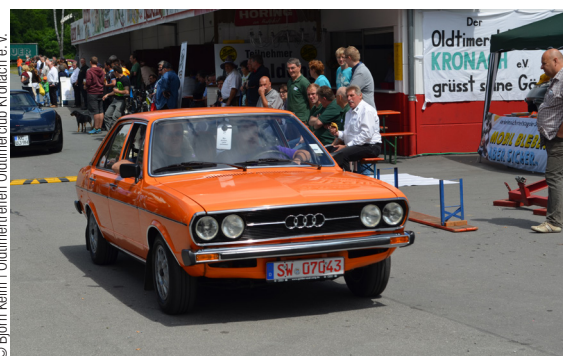
© Björn Keim | Oldtimertreffen Oldtimerclub Kronach e.V.