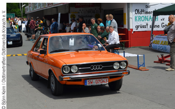
Oldtimertreffen Oldtimerclub Kronach e.V.