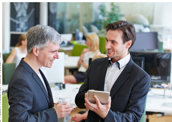
© Robert Krieschke - Fotolia #69631492