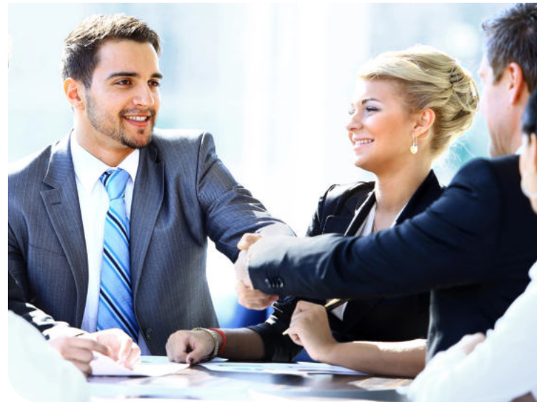
Ein optimiertes Absicherungskonzept schützt Ihr Unternehmen vor den finanziellen Folgen eines Ausfalls von Schlüsselpersonen.

Aufgrund ihres Wissens, ihrer Kontakte und ihrer Erfahrungen, ist eine Schlüsselperson der Motor, der das Unternehmen am Laufen hält. Der längerfristige Ausfall z. B. eines Geschäftsführers oder Spezialisten kann für ein Unternehmen daher beträchtliche finanzielle Auswirkungen haben. Schließlich müssen die Geschäfte und Projekte weitergeführt sowie Kontakte aufrechterhalten werden. Vor allem für Existenzgründer oder kleine und mittelständische Unternehmen kann der Ausfall von Leistungsträgern zur Existenzfrage werden.